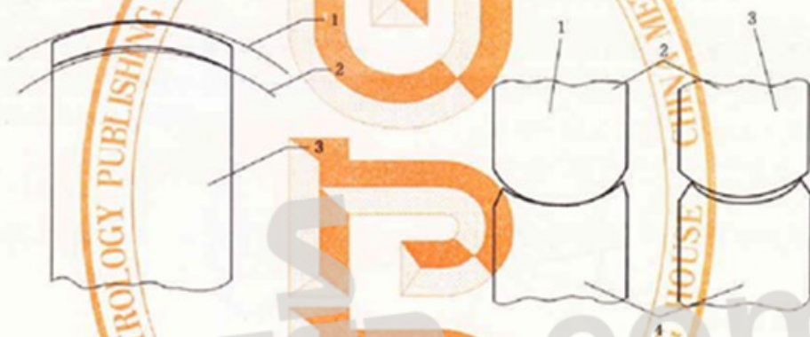
图3 极限放大图比较法

在投影仪的投影屏上，用极限放大图的方法进行比较测量（见图3）。测量时，将被测半径样板放在仪器的工作台上，选择适当放大倍数的物镜，用极限放大图去套半径样板在投影屏上的影像；影像小于等于极限放大图的最大极限尺寸且大于等于极限放大图最小极限尺寸，判定该半径样板合格，否则判定为不合格。